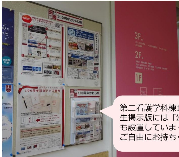
@第二看護学科棟1階 *第一看護学科棟1階にも掲示中

第二看護学科棟1階の学生掲示板には「頒布版」も設置しています！ ご自由にお持ちください。