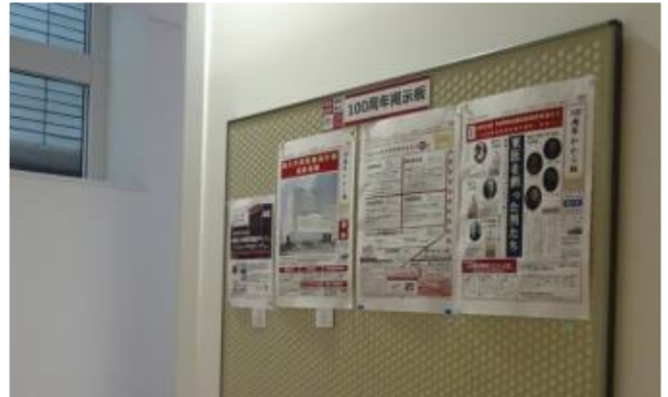
* 自主自学館渡り廊下(2階・6階)にも掲示中