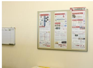
* 研修医室にも掲示中