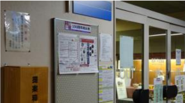
@本館6階 職員食堂横