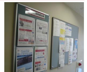
* C館3・4・5階にも 掲示中