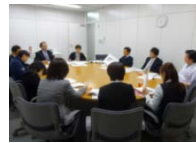
小会議室にてラフミーティング