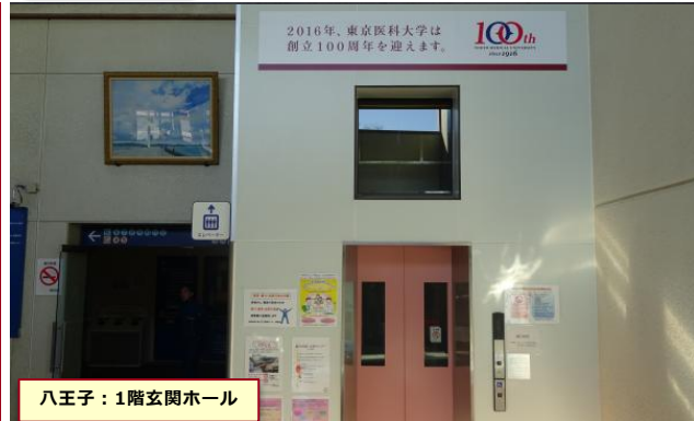
八王子：1階玄関ホール

2月11日茨城に、2月14日八王子に100周年広告シートを取り付け、全キャンパスの掲出が完了しました。