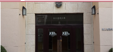
▲第二看護学科棟(旧本部棟)入口