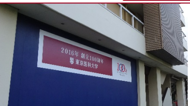
【大学】 ▲基礎新館壁面